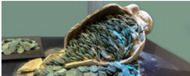
Foto: Der erst jüngst entdeckte Münzschatz von Sevilla umfasste mehrere prallgefüllte Amphoren.

Sogenannte „Schatzfunde“ konnten in der Römerzeit durch unterschiedlichste Begebenheiten dem Boden anvertraut werden. Einfallende Germanen im 3. und 4. Jh. n.Chr. im Grenzgebiet der Nordwestprovinzen, der Vesuvausbruch von 79 n.Chr. oder Bürgerkriege unter rivalisierenden römischen Kaisern – mit Hilfe der modernen Archäologie kann man zahlreiche Fragen zu Motiven und Schicksal der ehemaligen Besitzer beantworten und die Funde in einem Gesamtkontext erklären. Der bildreiche Vortrag zeigt umfangreiche Schatzfunde von Götterfiguren über Küchengeschirr bis hin zu Werkzeugen und Waffen. Anmeldung erforderlich unter 02173-9518930 oder hausbuergel@monheim.de.